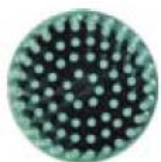
Diam. 25 mm