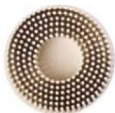
Diam. 50 mm