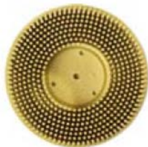
Diam. 75 mm